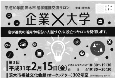
2月15日 企業×大学コラボ

この季節、乾燥がつづきインフルエンザが猛威を振るっています。私の周りでも、あまり熱が出なかったのに、インフルエンザではないだろうと思いつつ病院で検査をうけたらインフルエンザだったという方もいらっしゃいます。この程度なら大丈夫と思っていると、知らない間にインフルエンザに感染している場合があります。A型B型と言われますが、その違いを調べてみました。インフルエンザウイルスは、ABCの3つに分類されます。毎年のように流行するのがA型とB型です。A型は人や鳥、豚などの動物も感染し、144種類のウイルスの亜型が存在し、人にかかわるのは主に2種類。12月頃から流行が始まります。B型は人と人との間でのみ感染し、亜型は2種類で、流行はA型よりも遅く、2月頃からはかかる人が増えてきます。以前、B型は高熱が出ないのが特徴といわれていたのですが、昨今はどちらも高い熱が出て、吐き気、嘔吐などの消化器症状もあります。ただし、65才以上の高齢者にとってはB型の場合、罹患者の約60%が38度以下、約20%は37・5度以下と微熱しか出ないことが多いのです。高齢者は具合が悪く、微熱がある時は、ただの風邪と自己判断せず、医師の診察を受けることが大切。抗体は2週間できるので、この時期でもワクチン接種は有効です。そして30秒の手洗いやアルコール消毒、マスクの装着は必須。予防にはビタミンDが効果的。ビタミンDは日光浴で増えるため、手のひらを20分、日光にかざすだけでもいい。また、水分補給はこまめに。特にカテキン豊富な緑茶をまめに飲むといいとのこと。手洗いうがい・休養・栄養です！