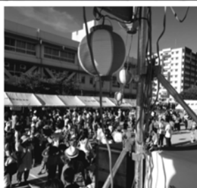
穂積地区ふるさとまつりにて