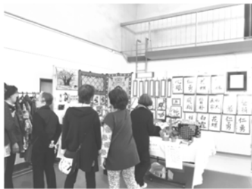
春日丘小文化展にて

3月議会に「茨木市障害のある人もない人も共に生きるまちづくり条例」が提案されました。「障害者差別解消法」の趣旨に則り、「障害を理由とする差別の解消」について行政機関は『不当な差別的取り扱いの禁止及び合理的配慮の提供』を法的義務であるとされるだけでなく、一步踏み込んで民間事業者に対しても、合理的配慮の提供を条例上の義務としています。障害者差別の解消は市民みんなの課題であるということです。誰もが安心して暮らせる茨木になるように！