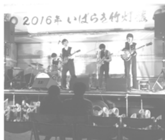
2016年 いばらき竹灯籠にて