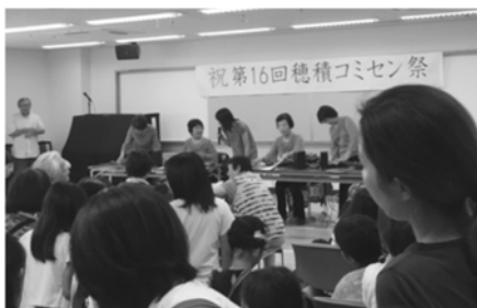
第16回 穂積コミセンまつり

子どもたちが生まれた家庭環境に左右されずに、将来に夢を描けるような支援を是非茨木市で、もっともっと進めていきたいです。