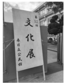
春日丘公民館文化展にて