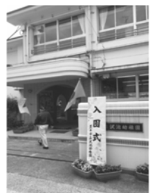
沢池幼稚園 入園式にて

目の前にいる、貧困の中で大人になる子どもたちに、是非茨木市として支援して欲しいとの気持ちでしたが、本会議でも、賛成者少数で否決されました。私の落胆は、なかなか収まりませんが、自分の力不足を反省しながら、これにめげず、大事なことは大事といい続けます。頑張ります！(討論の内容はHPに掲載します)