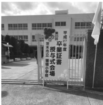
穂積小 卒業式にて

す。その一つに東京足立区があります。私は歯科検診後、治療に行っていない家庭をみることに、発見の指標になるという取組は、とても興味深いものでした。本市も、先進的な取組みをされている自治体を参考に、新たな指標で貧困の実態調査に取り組んでいただきたいと思います。それによって埋もれている子どもたちの姿が見えることを期待しています。支援の届かない子どもが一人でも少なくなりますように。