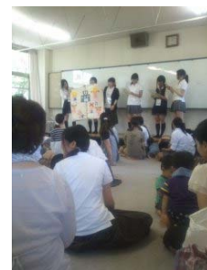
茨木西高校での保育交流、地域のお母さんたちと一緒に